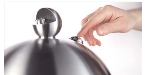
Bedienung durch beständiges Drücken des Druckknopfes