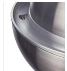
Sieb in der Ablaufrinne zur Verhinderung von Verstopfungen