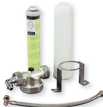
5 Anschlusset zu Filter 42-202 und 42-203 260 x 160 x 100 mm