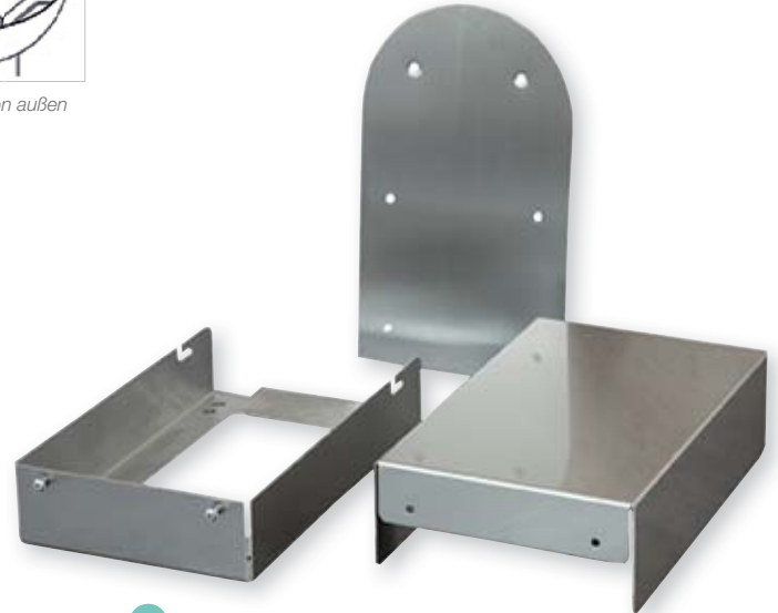
2 Vorwandblende für Trinkbrunnen mit Wandkonsole, Serie Lobo 294 x 168 x 75 mm