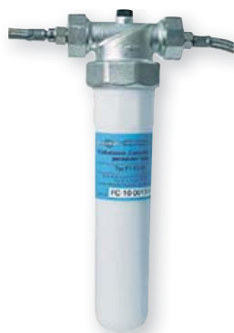
3 Carbon-Filter zur Reinigung 352 x 146 x 88 mm

Optional: Wasser- filterung und -vitalisierung