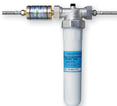
4 Vitalisierungsgerät und Carbon-Filter 352 x 240 x 88 mm

Optional: Wasser- filterung und -vitalisierung