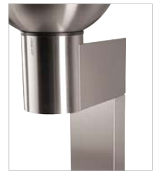
Vorwandblende zur Abdeckung von Anschlüssen