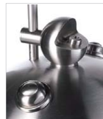
Trinkbrunnen mit Trink- und Flaschenfüllarmatur und zwei Druckknöpfen